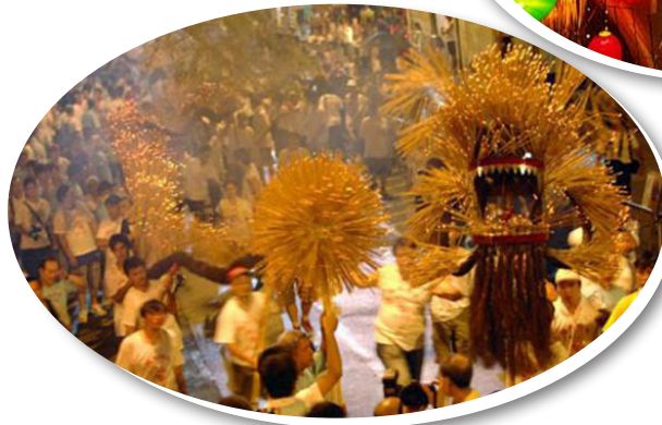
Múa rồng trong dịp Tết Trung Thu ở Hồng Kông