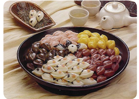
Bánh Songpyeon của Hàn Quốc

Tết Trung thu tại Hàn Quốc là ngày Chusok hay còn gọi là Lễ tạ ơn, một trong những ngày lễ lớn ở Hàn Quốc. Nếu như Tết Trung thu ở Việt Nam chủ yếu dành cho thiếu nhi, thì ở Hàn Quốc lại là ngày lễ lớn, người Hàn Quốc luôn dành 3 ngày nghỉ để sum họp bên gia đình và bè bạn. Trong ngày lễ này, rất nhiều hoạt động thú vị, thể hiện những ước muốn, phong tục tập quán của người Hàn. Giống như bánh trung thu tại Việt Nam, bánh Songpyeon là một loại bánh không thể thiếu trong ngày Trung thu. Loại bánh này được làm từ gạo xay thành bột, bên trong có đậu xanh, hạt dẻ, đậu đỏ, mè. Mọi gia đình đều cố gắng làm được những chiếc bánh Songpyeon đẹp nhất, ngon nhất để thờ cúng tổ tiên, thể hiện lòng tôn kính của họ đối với những người đã khuất. Trong ngày Trung thu cả gia đình đi viếng mộ tổ tiên và dâng thức ăn thể hiện lòng thành kính. Mọi người còn mang theo bánh, rượu hoặc một giỏ trứng đến thăm họ hàng thân thuộc, hoặc tham gia các trò chơi dân gian trong ngày lễ này. Buổi tối, trẻ em mặc hanbok (một loại trang phục truyền thống của Hàn Quốc) và cùng nhảy múa dưới ánh trăng.