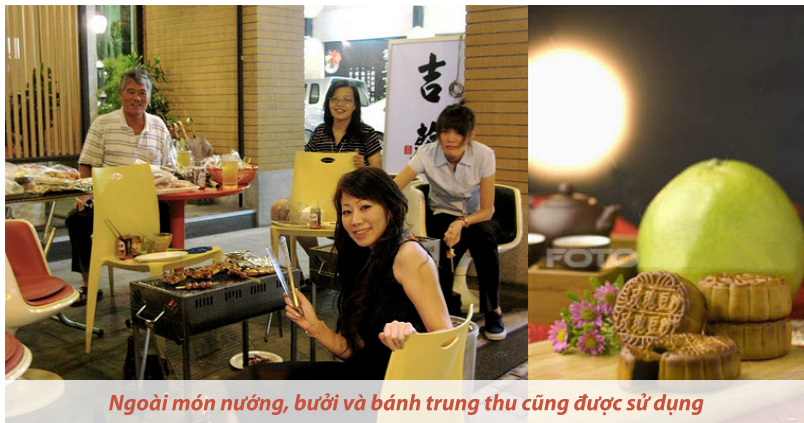
Ngoài món nướng, bưởi và bánh trung thu cũng được sử dụng

“Phố Tàu” tại Singapore cũng tưng bừng trong không khí lễ hội Trung thu. Du khách sẽ được chiêm ngưỡng màu sắc rực rỡ của cả khu phố khi mọi nhà cùng đồng loạt thắp sáng các loại đèn. Ánh sáng rạng rỡ của lễ hội đèn lồng sẽ tiếp tục trong nhiều tuần liền. Du khách có thể dễ dàng mua một chiếc đèn lồng tại tiệm bên đường với đủ loại khác nhau, từ truyền thống làm bằng giấy đến loại làm bằng nhựa phỏng theo mô hình các nhân vật hoạt hình. Ngoài ra, các loại thực phẩm truyền thống trong Tết Trung thu cũng được bày bán như bưởi, trà, và bánh trung thu với rất nhiều loại hương vị khác nhau. Ngoài đường phố còn có chương trình tạp kỹ hàng đêm với những màn múa lân sư rồng độc đáo.