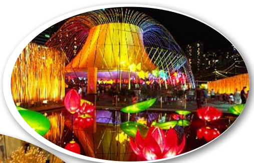
Lễ hội đèn lồng