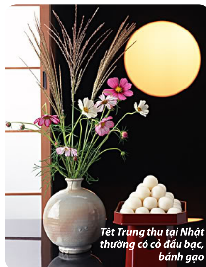
Tết Trung thu tại Nhật thường có cỏ đầu bạc, bánh gạo

Ở Nhật mỗi năm có 2 hội thưởng trăng. Hội đầu là Zyuyoga-ngắm trăng vào ngày rằm giữa mùa thu, tiếp đến là hội Zyusanya vào ngày 13 tháng 10. Người Nhật thưởng Trăng với mâm cỗ thường được trang trí bằng cỏ đầu bạc Nhật Bản (susuki). Mâm cỗ được bày trên một bệ đứng hoặc bàn, đặt ở ngoài hiên nhà hoặc gần cửa sổ. Các loại thực phẩm khác nhau được trưng bày trong những kỳ trăng khác nhau. Chẳng hạn như khi trăng tròn, người Nhật thường sử dụng khoai lang, khi trăng khuyết, người Nhật sử dụng đậu hay hạt dẻ. Trung thu người Nhật thưởng ăn bánh bao gạo gọi là "Tsukimi dango" được làm theo hình dạng trăng. Người Nhật Bản cho rằng Thổ Ngọc sinh sống trên mặt trăng, vì vậy khi ngắm trăng thường tưởng tượng như đang nhìn thấy một chú thỏ đang ăn bánh bao. Trẻ em Nhật Bản rước đèn cá chép trong các hội thưởng trăng vì cá chép tượng trưng cho lòng can đảm. Truyền thuyết cho rằng cá chép là hiện thân của võ sĩ Samurai vì nó dám lội ngược dòng thác nước.