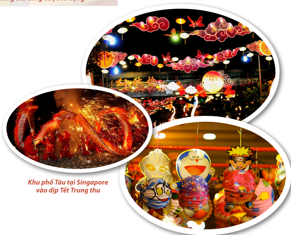
Khu phố Tàu tại Singapore vào dịp Tết Trung thu

“Phố Tàu” tại Singapore cũng tưng bừng trong không khí lễ hội Trung thu. Du khách sẽ được chiêm ngưỡng màu sắc rực rỡ của cả khu phố khi mọi nhà cùng đồng loạt thắp sáng các loại đèn. Ánh sáng rạng rỡ của lễ hội đèn lồng sẽ tiếp tục trong nhiều tuần liền. Du khách có thể dễ dàng mua một chiếc đèn lồng tại tiệm bên đường với đủ loại khác nhau, từ truyền thống làm bằng giấy đến loại làm bằng nhựa phỏng theo mô hình các nhân vật hoạt hình. Ngoài ra, các loại thực phẩm truyền thống trong Tết Trung thu cũng được bày bán như bưởi, trà, và bánh trung thu với rất nhiều loại hương vị khác nhau. Ngoài đường phố còn có chương trình tạp kỹ hàng đêm với những màn múa lân sư rồng độc đáo.