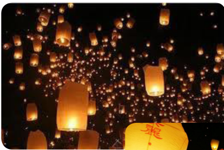
Đốt đèn Khổng Minh trong Tết Trung thu